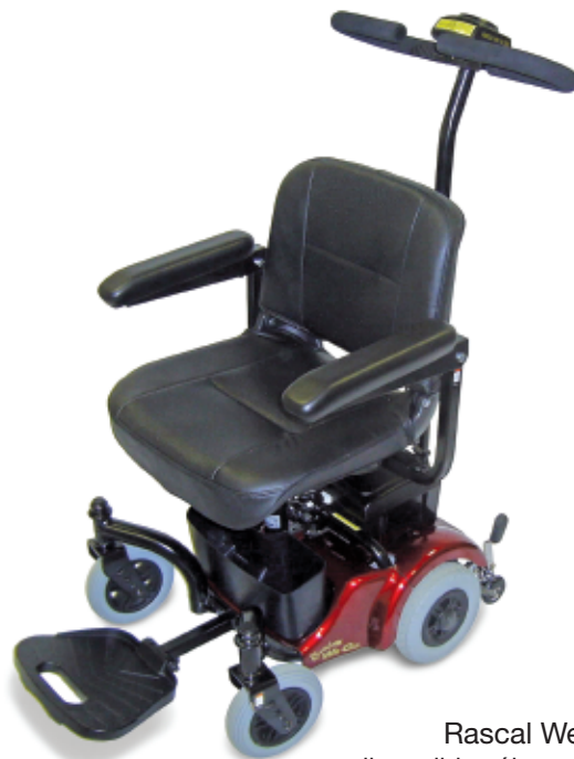
Rascal WeGo disponible sólo en rojo

Avenida Novelda 100 - 102, Alicante, España, 03010 Teléfono: 966 388 300 / Movil: 638 717 323 E.mail: Info@tallerbateriyalicante.com Pagina web: www.tallerbateriyalicante.com